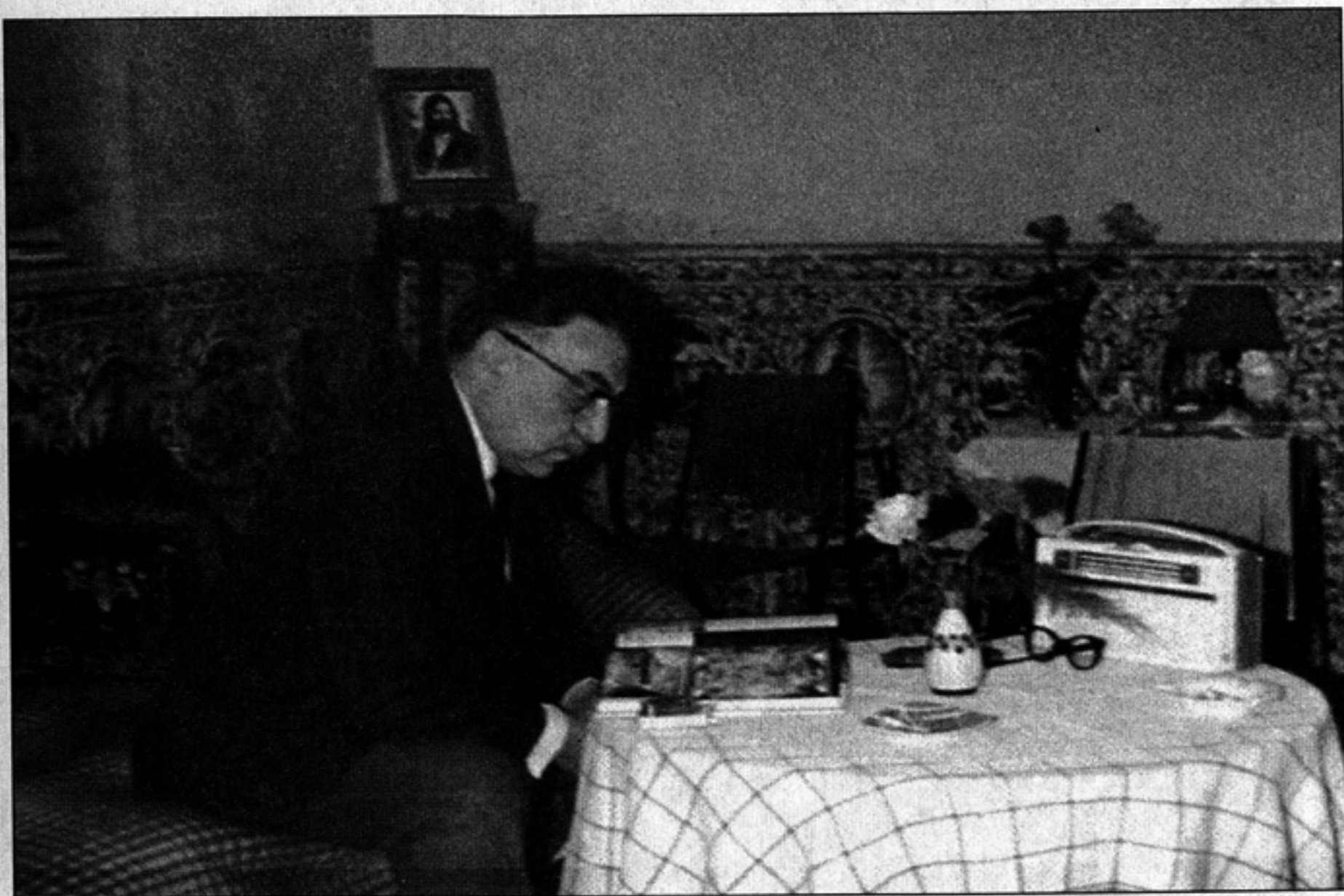
داود پیرنیا در دفتر کارش، در خانه‌ی مشیرالدوله، لاله‌زارنو، تهران

مایلم آخرین کلمه‌ها را با سخن بزرگ‌ترین خواننده‌ی کلاسیک فعلی، محمدرضا شجریان، به پایان برم که عقیده‌اش را درباره‌ی میراث و اهمیت برنامه‌های گلهای چنین بیان کرده است: این عقیده‌ی من است که موسیقی ایرانی به میزان زیادی مدیون داود پیرنیاست، زیرا او در لحظه‌ی بحرانی در تاریخ ایران موسیقی ما را به نحوی شایسته از تباهی نجات داد. اگر تلاش‌های او نبود، موسیقی عربی، ترکی یا موسیقی پاپ غربی، موسیقی ایرانی را تماماً محو و نابود می‌کرد. آقای پیرنیا با تهیه‌ی برنامه‌های گلهای حریمی برای موسیقی ایرانی ساخت که می‌توانست در میان همه‌ی نفوذهای معارض و فاسد خود را حفظ کند و ببالد، به طوری که برنامه‌های گلهای هنوز هم در میان عامه‌ی مردم وسیعاً مورد تحسین است. ۲۴